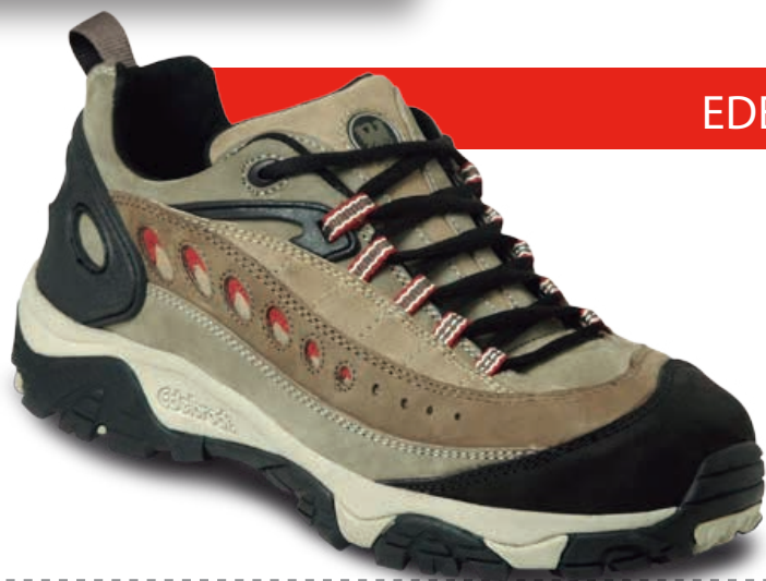
EDELBROCK ED - 108